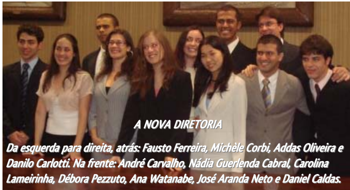
A NOVA DIRETORIA

Além disso, é realizado um trabalho diário de busca de novos convênios e ampliação dos atuais. Podemos ressaltar o interesse em abraçar a causa dos direitos humanos de imigrantes, objeto de divagações a